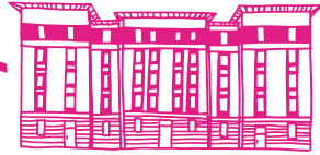
Bâtiment 81 rue Romain Rolland

Parce que l'objectif premier est de répondre aux besoins, de nos résidents, le projet des Grandes Cités Tase s'est construit avec eux. En 2018-2019, nous les avons rencontrés, nous les avons écoutés. Ces échanges ont guidé la définition du programme de travaux en cours.