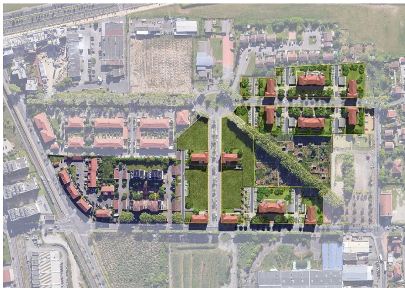
Plan masse du projet