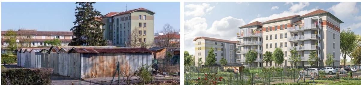
Les Grandes Cités Tase aujourd'hui et après leur réhabilitation.

Construites en 1924, les Grandes Cités Tase seront centenaires cette année. L'opération de transformation lancée par 1001 Vies Habitat, avec le soutien de l'État, de la Métropole de Lyon et de la Ville de Vaulx-en-Velin, a pour ambition de moderniser les logements, en les rendant plus confortables et plus économes en énergie ; réaménager les pieds d'immeuble ; raviver l'esprit des cités-jardins ; mettre en valeur une architecture remarquable, chargée d'histoire.