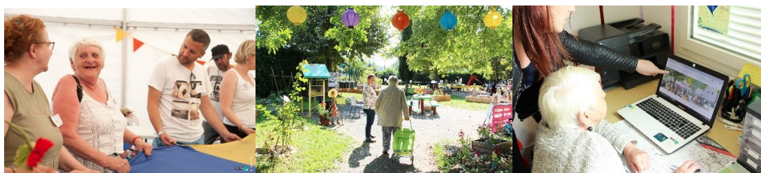
Fête intersites à Aix-les-Bains et accompagnement informatique à Lieusaint

Les habitants décident des projets collectifs qu'ils souhaitent mettre en œuvre : atelier socio-esthétique, renforcement scolaire, jardins partagés, ressourceries, clubs de sport, de randonnée, club de bricolage qui prend en charge les petites réparations dans les logements.