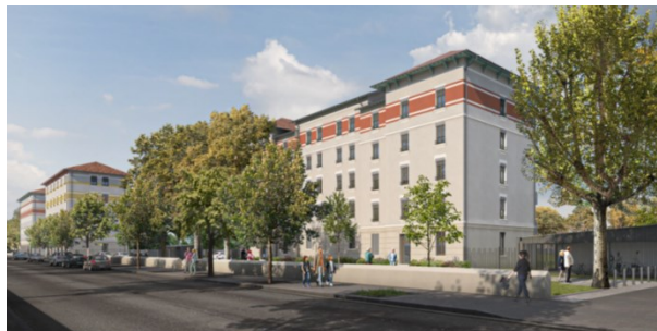
De haut en bas et de gauche à droite : Les Grandes Cités Tase au début du XX e siècle et aujourd'hui. Demain : elles retrouveront leurs façades historiques.