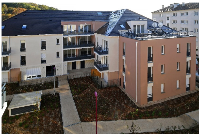
Résidence Clos Compan, Corneilles-en-Parisis

Revendiquant une expertise historique en renouvellement urbain, 1001 Vies Habitat développe une approche de bailleur-aménageur qui séduit les collectivités locales.